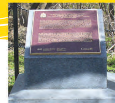
Monument érigé par Parcs Canada, rappelant la bataille de la rivière des Prairies, à la Coulée Grou, le 2 juillet 1690.

Au 17 e siècle, la pointe de l'île subit des attaques iroquoises. C'est une halte sur la route des fourrures. Des colons s'y installent dont trois Filles du Roy. La division des terres est de type seigneurial. Le village se développe le long du chemin public, l'actuel boulevard Gouin. Durant trois siècles, les cultures maraîchères et fourragères occupent une population agricole. Le 19 e siècle est la période des cageux, venus des pays d'en haut. La population s'accroît au milieu du 20 e siècle avec l'arrivée de migrants du Québec et surtout d'immigrants italiens, haïtiens et autres. En 2016, Rivière-des-Prairies est un quartier résidentiel de 58248 citoyens.